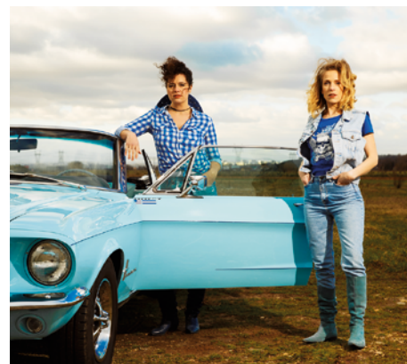
Thelma, Louise et Nous