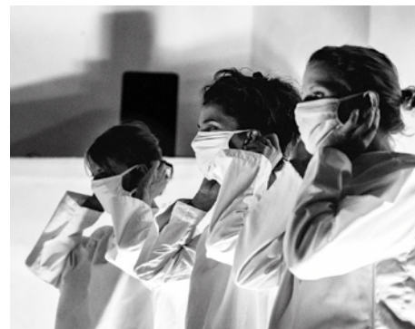
La nuit je rêverai de soleils

production Compagnie La Grande Panique • coproduction Théâtre des Clochards Célestes .