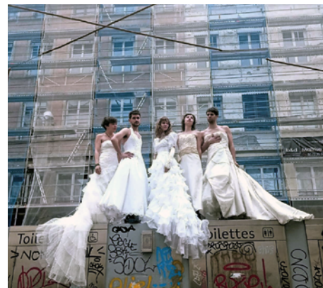
Les Sentiments du Prince Charles

production Morgane • coproductions Les Quinconces & L'Espal, Scène nationale du Mans ; Comédie de Colmar - CDN Grand Est Alsace ; Théâtre Ouvert - Centre National des Dramaturgies Contemporaines ; CCNG - Centre Chorégraphique National de Grenoble, dans le cadre de l'accueil studio, CND à Lyon •