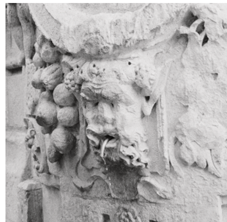
SOIF ONDE TITRE PROVISOIRE