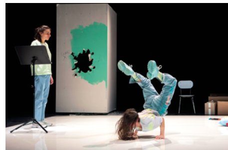
L'Âge de détruire